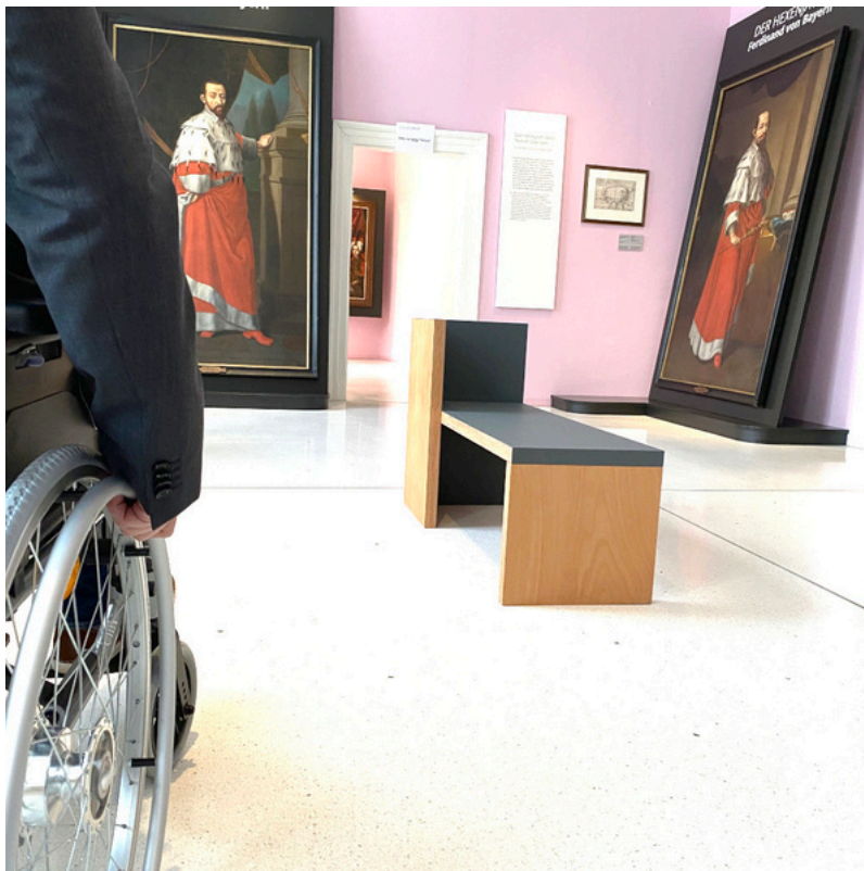
Mit Rollstuhl unterwegs im Sauerland Museum | Sauerland Museum