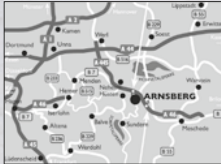
Abfahrt 66 Arnsberg-Uentrop